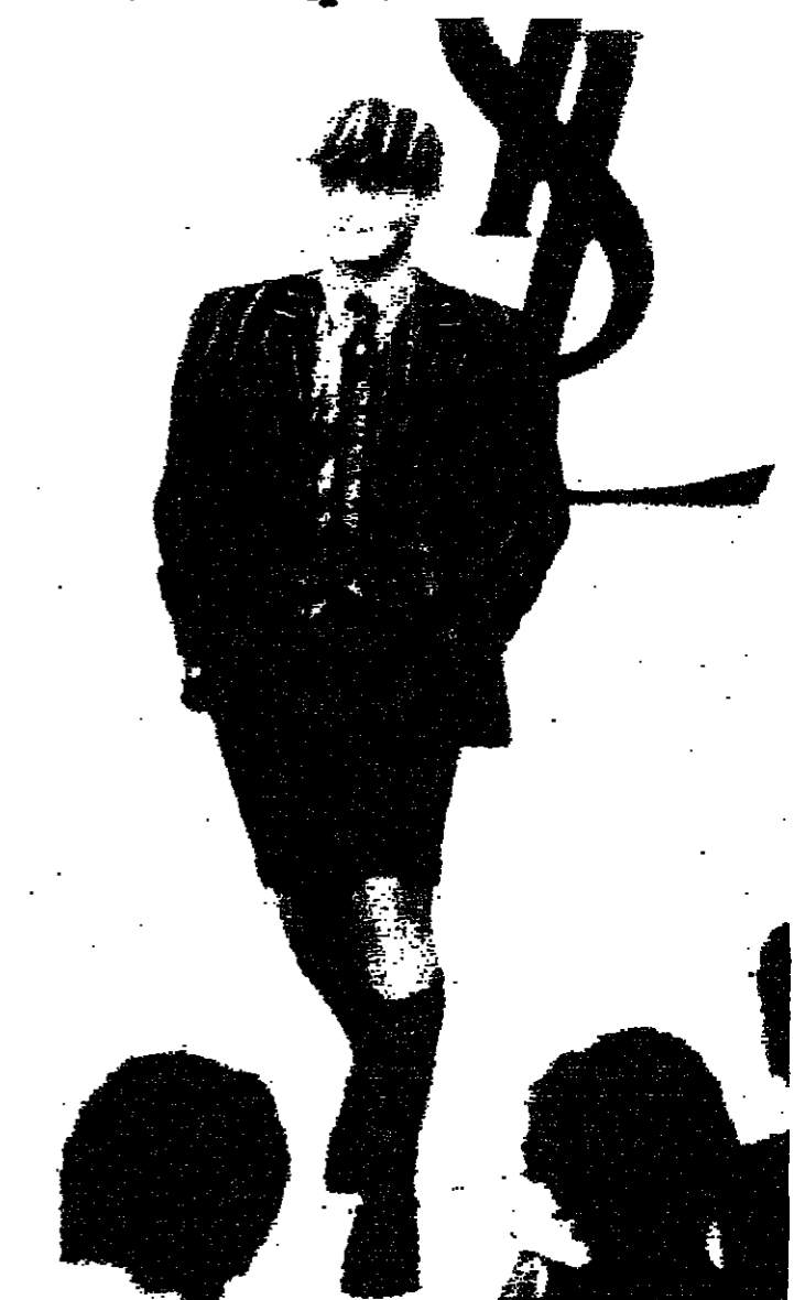
يقوم هذا العرض بتقديم بذلة رجالية مؤلفة من جاكيت مخططة وبقعة مناسبة وسروال صروداء. العرض حصل في باريس في ٧ الجاري والبلدة من مجموعة ايف سان لوران ريف غوش، موسم خريف وشتاء ١٩٨٩.